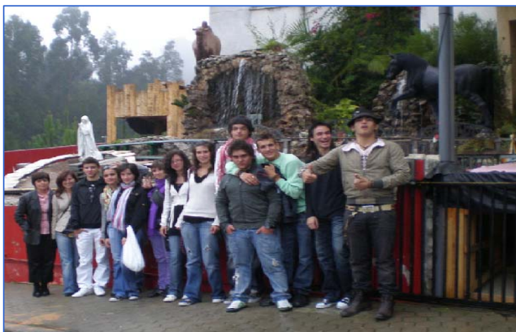
O grupo e os formadores diante do presépio frente às instalações da Cavalinho

Visitamos uma fábrica de pequena dimensão mas grande em prestígio, organização e sucesso.