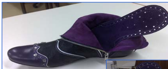
Deodato Maciel — modelo a concurso